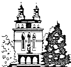
St. Laurentius Heiligenwald