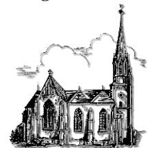
St. Martin Schiffweiler